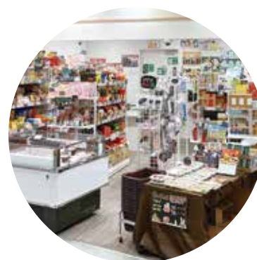
イオンモール 神戸南店