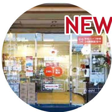
湊川店 2022年11月に無人店舗1号店としてオープンしました。