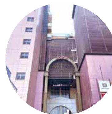
アスピア明石店 FC1号店