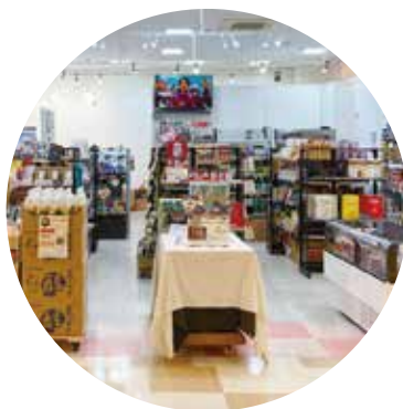
ブルメール HAT神戸店